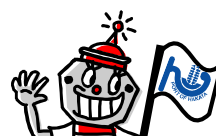
博多港のキャラクター『ポートくん』

問い合わせ先 一般社団法人博多港振興協会 担当：脇 〒812-0031 福岡市博多区沖浜町 12-1 電話：092-271-1378 FAX：092-282-4757