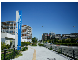
アイランドシティまちづくりエリア