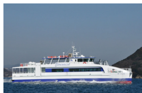
市営渡船「ゆうなみ」