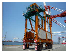
環境に配慮した荷役機械