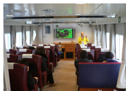
港務艇「なのつ」の船内