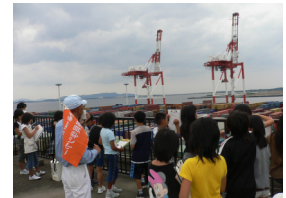
香椎パークポートコンテナターミナル屋上見学

香椎パークポートコンテナターミナルの管理棟屋上から、間近でコンテナを運ぶ様子や、対岸のアイランドシティを見ることができます。