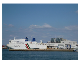
博多港国際ターミナル