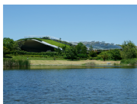
アイランドシティ中央公園